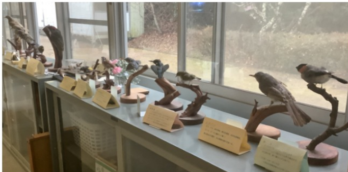
“鳥の剥製” Stuffed bird

左の写真のように児童玄関には大きなスズメバチの巣がケースの中に昔から置いてあります。