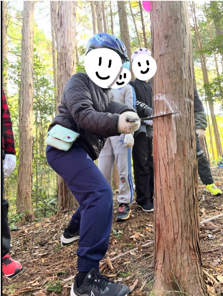
↑ 間伐をしている (Thinning the forest)