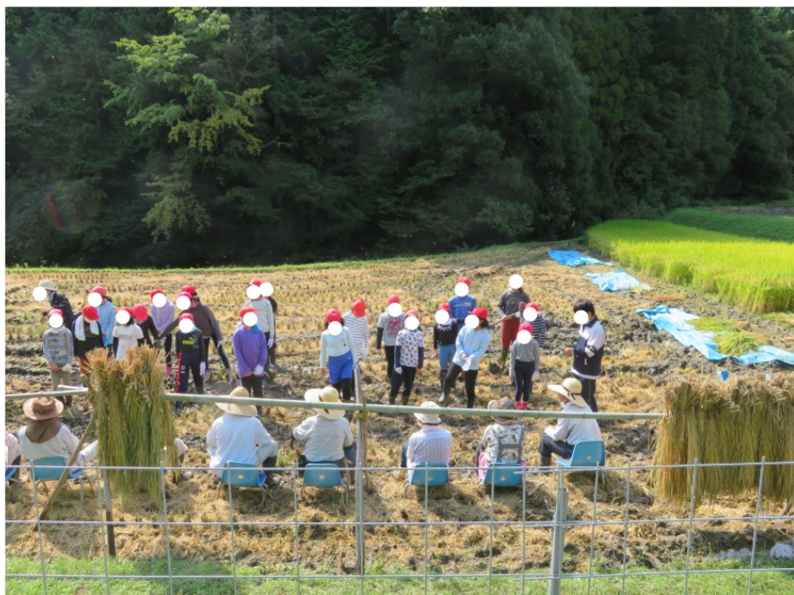
稲刈りの様子 Rice harvesting