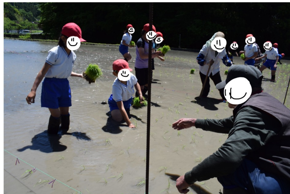
田植えの様子 Rice planting situation