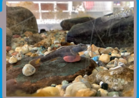
→ ヨシノボリ (Yoshinobori)