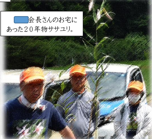
会長さんのお宅にあった20年物ササユリ。