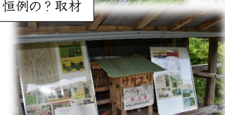
現5年生作のパンフレット掲示板～ 教頭先生が設置に行ってくださいました