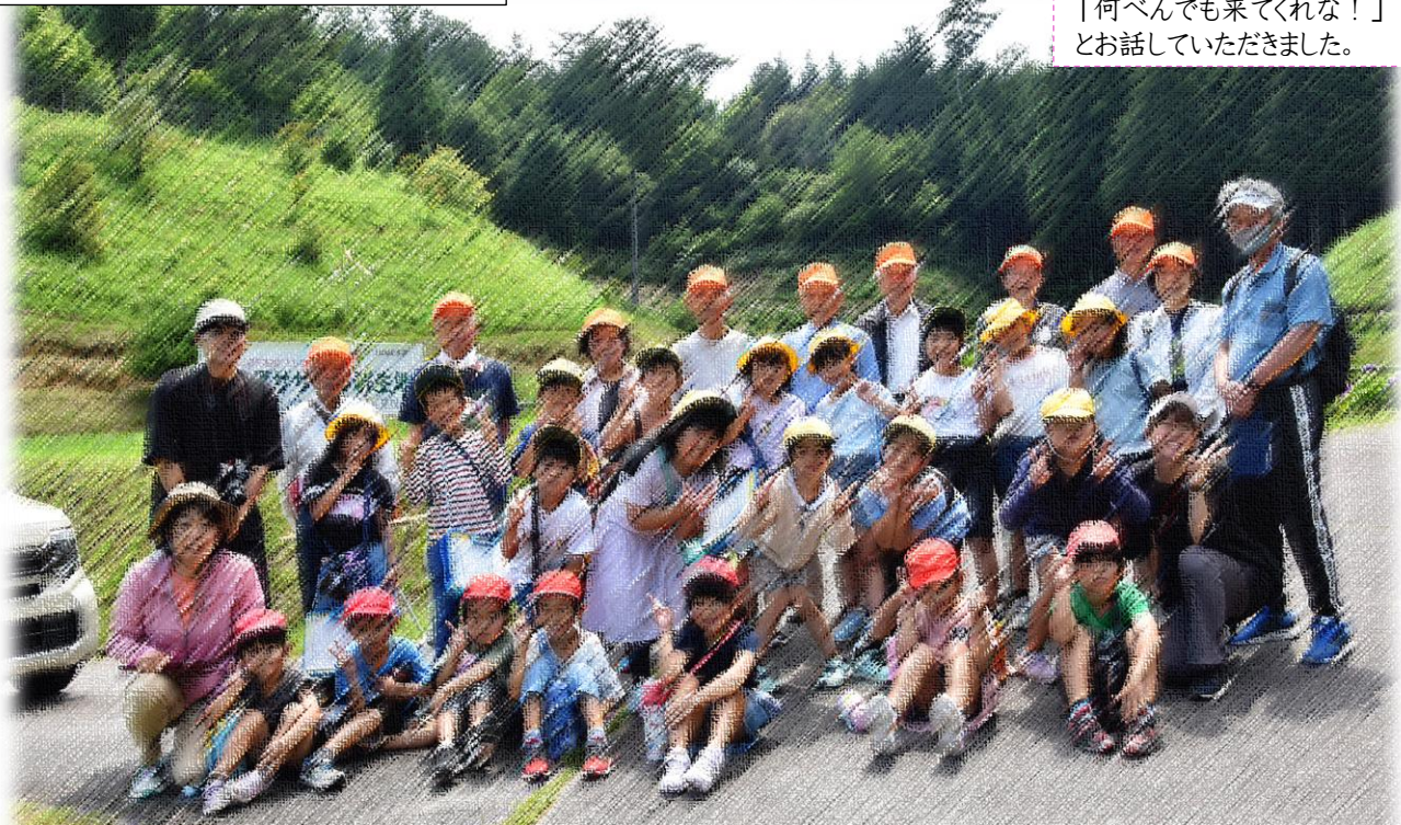
3年生質問タイム～「ササユリのために僕たちができることはありますか?」の質問に育成会の方たちの笑顔が広がりました。