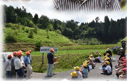
◆学年毎の動きでしたが、顔が見えると、「お～い」「ヤッホー」のやりとりがあり、思わず笑顔でしたね。育成会の方たちも「大勢で来てくれるといいな。元気がでるな」と喜んでみえました。「何べんでも来てくれな!」とお話していただきました。