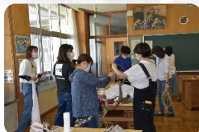
お母さんパワーで、火文字も美文字！