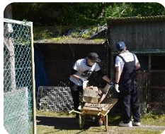
お父さんパワーで、井桁ばっちり！