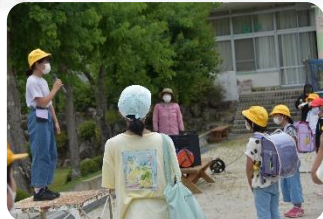
PTA 奉仕活動～神がかり的なお天気でした