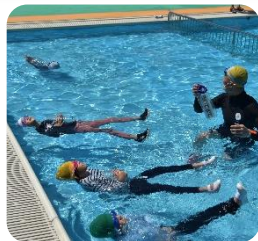
着衣泳「ういてまで」(浮いて待て) ↑