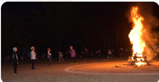
5年生の堂々たるエールマスター、6年生の息ぴったりのト ワリング～おかげで、心に残る楽しい時間になりました！