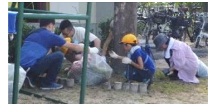
出校日の親子草取り