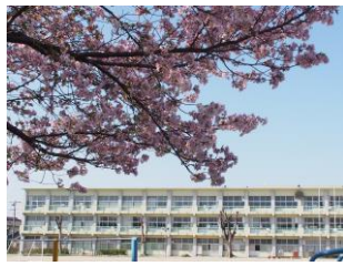
進級・入学を祝う桜