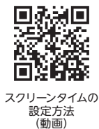
スクリーンタイムの設定方法(動画)