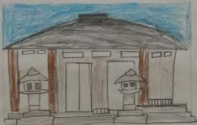
名前 ばいとうほと