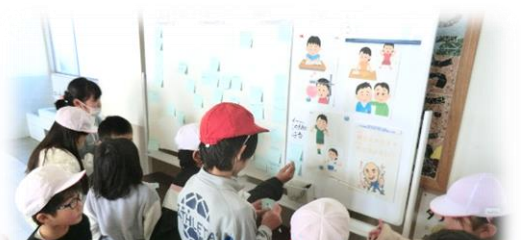
種をまかなきゃ花は咲かない！ 願いは「種」花は「成長した自分」