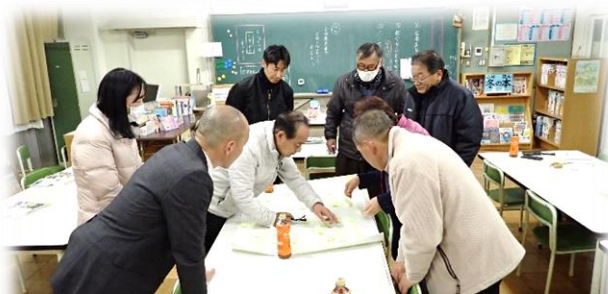
ざくばらんに論議して、ビジョンを共有する