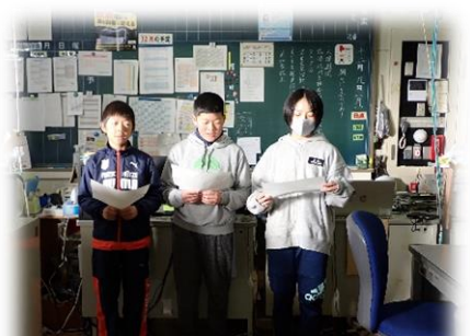
私たちに任せてください

6年生の代表委員が「 みんなが仲良くなれるように、クリスマス企画 をやりたい」と動き出していました。今週の月曜日の朝に、企画の趣旨や実施方法等について、職員室の先生に話をし、 協力を依頼 しました。内容をどうする、時間をどうする、役割をどうするなど、計画段階から しっかりと話し合 って進めてきました。代表委員以外の 仲間の協力 もあったそうです。みんなで 支え合い、認め合い ながら前に進む6年生。頼もしいです。