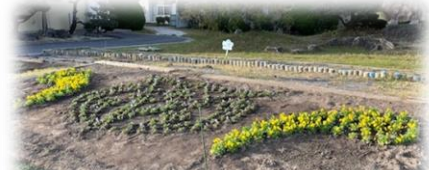
春が楽しみですね