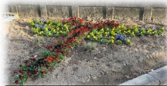
ヒントがなくても分かるかな