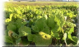
順調に育っています

六ツ美中部小学校・社教委員会・PTA・同窓会 令和6年度4年1組 西工 山崎建設株式会社