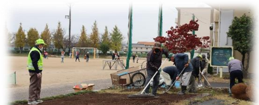
地域の方は、学校の一員です

本校の花壇は、 地域とともにある学校の象徴 となっています。花壇から、 地域の方の愛情 をいっぱいを受けて、中部っ子は 豊かな心 を育てています。