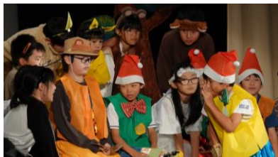
4年 ぼくらは宇宙のペンキ屋さ！

たとえば、「これからぼくらの仕事の、はじまりはじまり〜」というセリフのところです。歩いて少しずつぶたいの真ん中のほうに行き、右手をグーにして自分のむねを軽くたたたく動きを考えました。