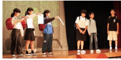
6年1組 タピオカ・ツンドラ

本番前は、緊張しましたが、いつも見てきた仲間の姿を見て落ち着くことができました。また最後の群読の部分では、これまで頑張ってきたことや最上級生として学校を引っ張っていくという思いをもって、一言一言を伝えることができました。 最後の学芸会、最高の思い出になりました。