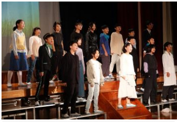
6年2組 エルコスの祈り

ぼくにとって今回の学芸会は、小学校最後のものなので、今までで一番よくなるようにがんばりました。 がんばった事は、見ている人「あの子すごいな」とか「声が大きくてカッコいい」と