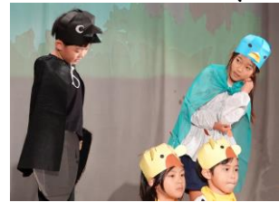
2年 からすはやつぱりくろがおにあい

こし自しんがついて、ぜったい大せいこうさせるぞと思ひました。そのおかげで大きな声ではきはき言えました。来年も大せいこうさせたいです。