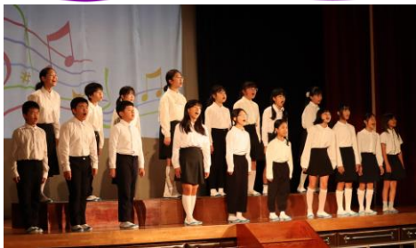
合唱部 「365日の紙飛行機」「歌が息をする」