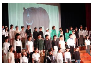
5年 ぞうれっしやよ走れ

私が一番大変だったことは、二週間しかない練習期間の中で五年生全員で練習を行ったことです。音程が違っていたら修正をしたり、必ず指揮者の方を見て笑顔や悲しそうな顔で場面を表現したりすることが大変でした。また、セリフを言うときや歌の中で、身ぶりや手ぶりを加えるなど覚えることもたくさんあって大変でした。