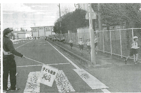
マラソン大会走路警備