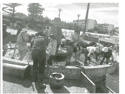
丸池の水、全部ぬく(丸池清掃)