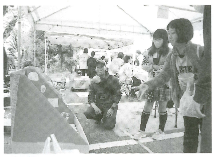
六ツ美中部学区ツナグ秋祭

子どもも御家族に支えられながら参加し、幅広い世代の方々に楽しんで頂きました。予想以上の大盛況に終わり私達PTAもとても有意義な時間を過ごすことが出来ました。そして、十二月十四日(木)はマラソン大会が行われ、私達PTAは警備をしながら子供達を見守りました。子供たちが走るために迂回して頂いたり、少し待って頂いたり御理解と御協力いただきありがとうございます。また来年も楽しくマラソン大会が無事に行われるよう細心の注意を払ってまいります。