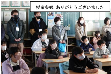
授業参観 ありがとうございます