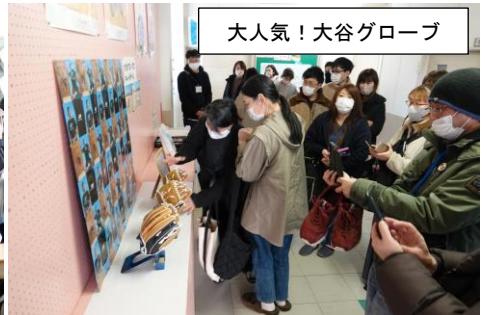
大人気!大谷グローブ