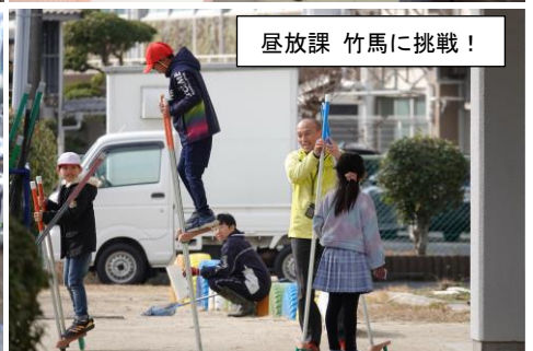
昼放課 竹馬に挑戦!