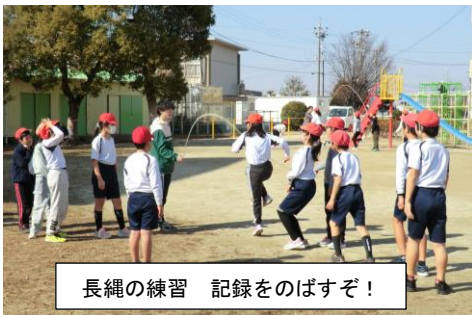
長縄の練習 記録をのばすぞ!