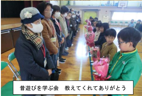
昔遊びを学ぶ会 教えてくれてありがとう