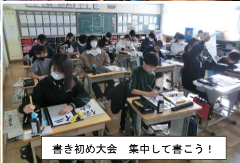
書き初め大会 集中して書こう!