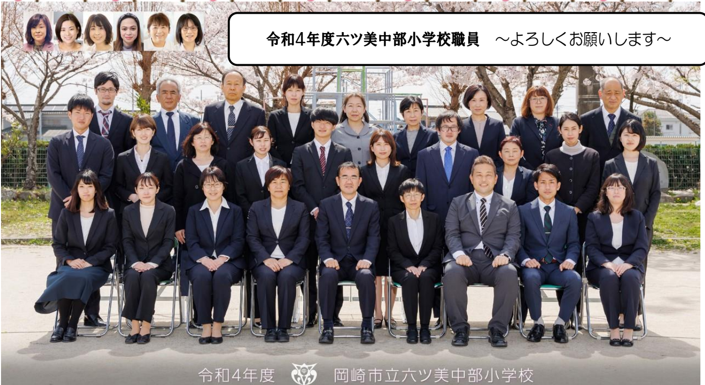
令和4年度 岡崎市立六ツ美中部小学校