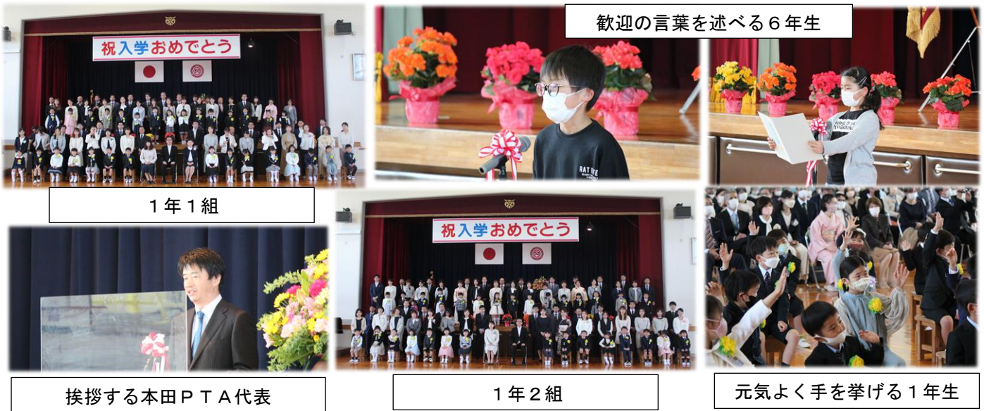
歓迎の言葉を述べる6年生