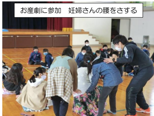
お産劇に参加 妊婦さんの腰をさする