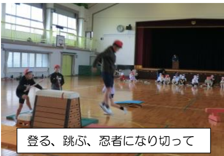
登る、跳ぶ、忍者になり切って