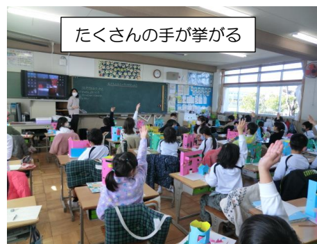
たくさんの手が挙がる

2年生が図工科で初めてカッターナイフを使って作品作りに取り組みました。組み立て前にカッターナイフでの作業を終えるなどのケガ予防をしておいた造形活動でしたが、子供たちは伸び伸びと作品作りを楽しみ、素敵いっぱいタワーを創りあげました。授業では素敵の発表が黒板を満たしました。