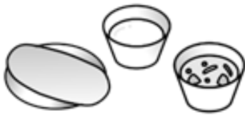
パン、脱脂粉乳、シチュー

せんご せんご えんじょ きゅうしょく さいかい 戦後は、アメリカの援助を受け、給食が再開され ました。昭和25年には、パン、ミルク(脱脂粉乳)、 おかずのそろった「完全給食」が実施されるよう になりました。