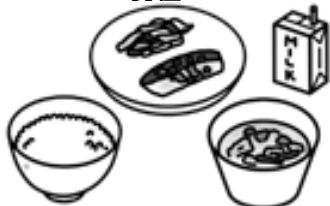
ごはん、牛乳、豚汁、 魚の南蛮漬け、おひたし

げんざい きゅうしょく えいよう 現在の給食は、栄養バランスがととのっている ことはもちろん、地場産物や郷土料理、行事食が とり入れられた「生きた教材」としての役割があり ます。