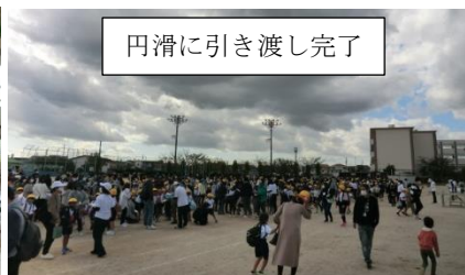
円滑に引き渡し完了