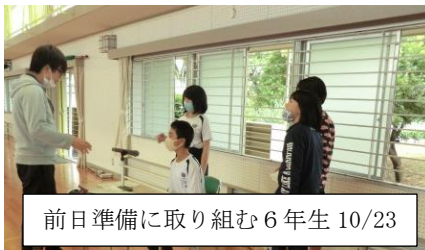
前日準備に取り組む6年生 10/23