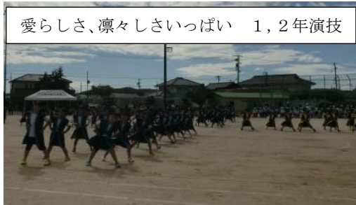
愛らしさ、凛々しさいっぴい 1,2年演技