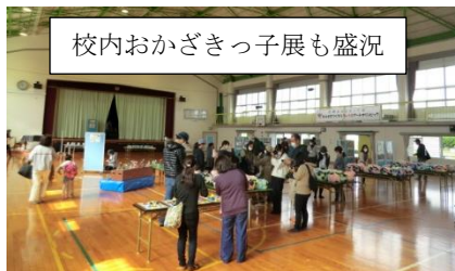
校内おかげさっ子展も盛況