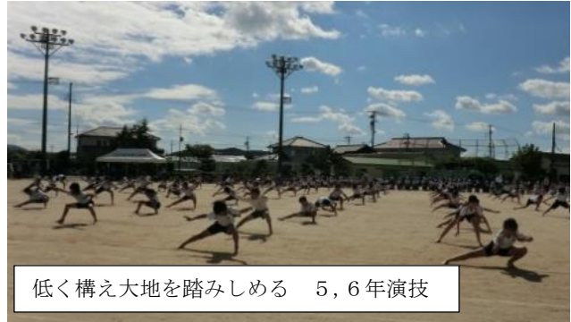
低く構え大地を踏みしめる 5,6年演技

1年生、「わっくわく」の運動会、練習から楽しみがばりました。笑顔いっぱい元気いっぴいでした。2年生、笑顔と元気いっぴいのダンスが、きらきら輝きました。太陽のように元気いっぴいの応援も素敵でした。3年生、難しい縄跳びの演技に挑戦し、ぐんぐん上手になりました。笑顔で仲間とつくる美しさも表現できました。4年生、休み時間も練習し、リズムに合わせた大きな演技ができました。一人一人の精一杯がつながりの美しさを生みました。5年生、元気いっぴい力いっぴいに自分を表現するあなたたちの挑戦は中部小学校にエネルギーを与えました。6年生、あなたたちは最高学年として中部学小学校を一步前へと進めました。大地を踏みしめ躍動する姿に感動しました。代表委員提案の「ペットボトルの応援」も素晴らしい。保護者の皆さん、ルールを守り温かく見守ってくださいました。ありがとうございました。