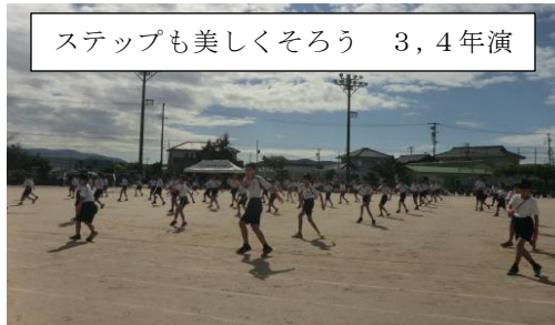
ステップも美しくそろろう 3,4年演