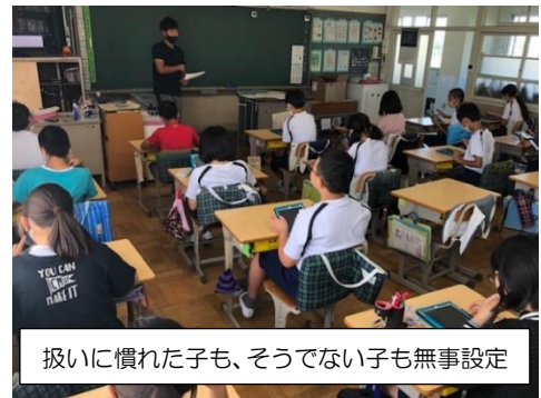
扱いに慣れた子も、そうでない子も無事設定

その一方で、雨模様の9月10日(木)の休み時間、6年生の教室ではタブレット端末を操作する子の姿が多くみられました。貸与が始まった嬉しさもあり、描画アプリケーション、プログラミング学習で利用したアプリケーションやそのグループでの共有など、思い思いに楽しんでいました。興味が高まっていることを理解しつつ、発達に与える影響などに気を付けたり、学校だからこそそのよさを大切にするように指導していきたいとも思います。