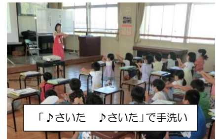
「♪さいた♪さいた」で手洗い

子供たちはさっそく給食前に、教えていただいたように童謡の「チューリップ」を歌いながら（2回歌うとちょうどよい時間だそうです）手を洗いました。