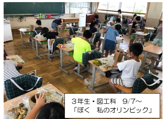
3年生・図工科 9/7~ 「ぼく 私のオリンピック」

9月7日(月)、3年生の子供たちはテーマを表現すべく粘土と向かい合い、粘土の手触りを味わいながら形作りや型押しを楽しみました。