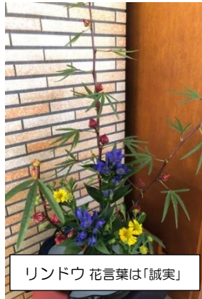
リンドウ 花言葉は「誠実」

朝夕に秋の気配を感じるこの頃です。日中は、暑い日もありますが、それでも子供たちは元気いっぱいです。登校してすぐに、ブランコを力いっぱいこぐ子供の姿があり、自然とこぼれる笑みと青空に吸い込まれそうなその勢いは、内側からみなぎるエネルギーが放たれているようでした。