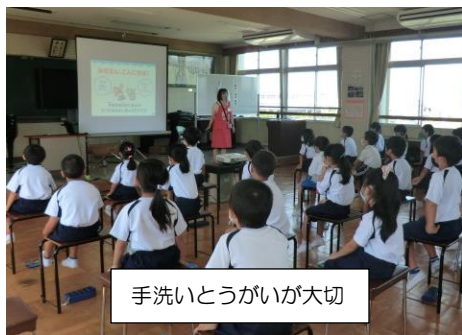
手洗いとうがいが大切