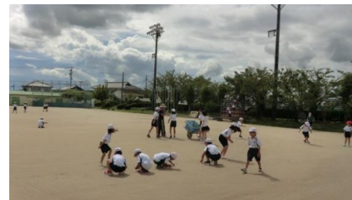
10本草取り。その後、元気に遊ぶ 9/11