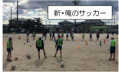
新・俺のサッカー