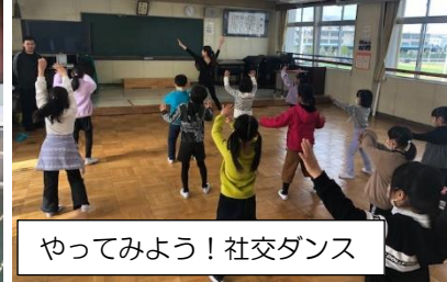
やってみよう！社交ダンス