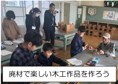
廃材で楽しい木工作品を作ろう

多くの皆様の御協力と御尽力に感謝します。笑顔や意欲にあふれたひとときとなりました。