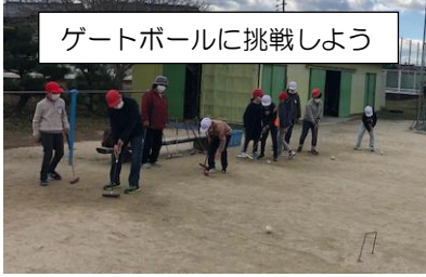
ゲートボールに挑戦しよう