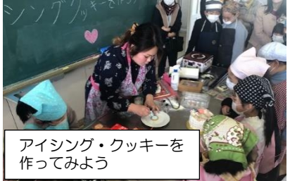
アイシング・クッキーを 作ってみよう