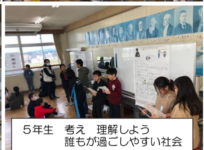
5年生 考え 理解しよう 誰もが過ごしやすい社会