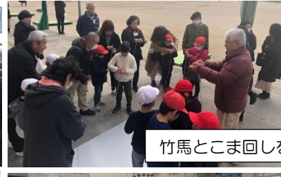
竹馬とこま回しをマスターしよう