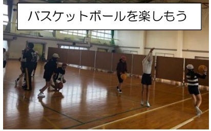
バスケットボールを楽しもう