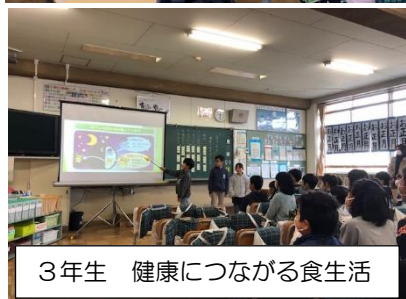
3年生 健康につながる食生活