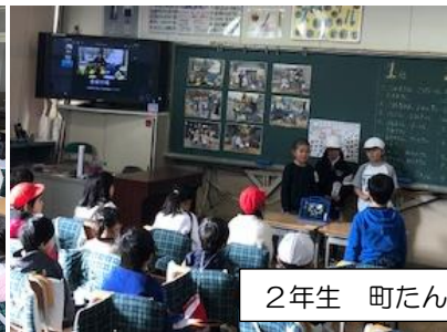
2年生 町たんけんに行ったよ