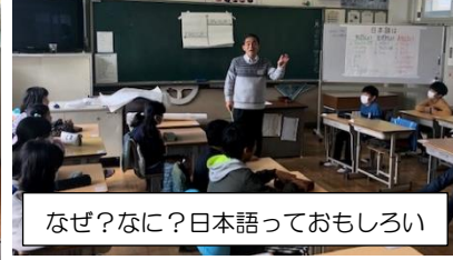
なぜ？なに？日本語っておもしろい