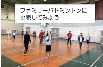
ファミリーバドミントンに 挑戦してみよう