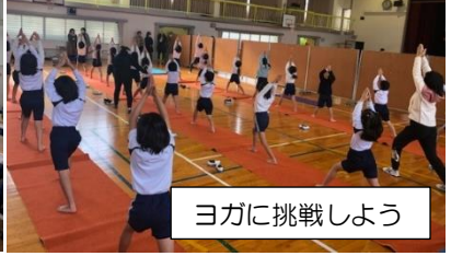
ヨガに挑戦しよう