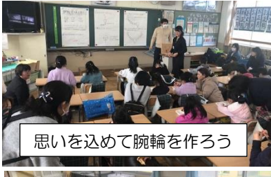
思いを込めて腕輪を作ろう