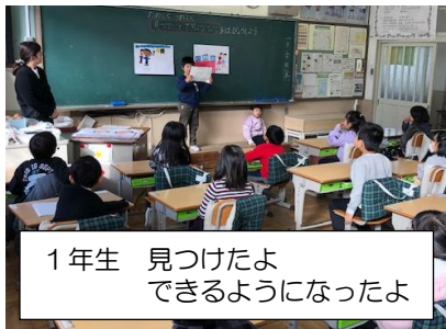
1年生 見つけたよ できるようになったよ

それぞれの学年のテーマに沿った体験的な学習を展開し、学んだことや感じたこと、考えたことを整理して発表しました。たくさんの経験を整理して、自分が発信したいことは何かを吟味して、限られた紙面や時間の範囲でまとめる姿がありました。発信だけでなく、聞く人から質問や意見を求めたり、交流する場面も見られました。学びの場や機会に満ちた学区とそれを支える御家庭、多くの御来場等、温かな環境に恵まれたことを感謝します。