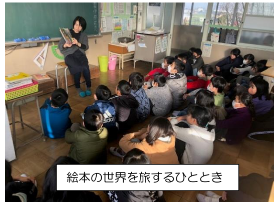
絵本の世界を旅するひととき

るるの会の皆様にお越しいただき、本年度12回目の「るるの会読み聞かせ」を行いました。「節分」や「豆まき」が題材の絵本などの読み聞かせに、すっかり引き込まれた子供たち。1年生から6年生までのどの学年の子供たちも絵本の世界に没頭しました。季節感や子供の発達段階を考慮しての絵本選びなどに御尽力くださり、最適な時間を毎回贈ってくださる御厚情に感謝します。