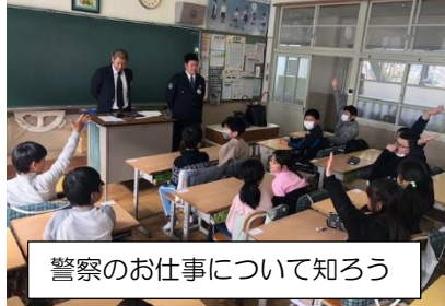
警察のお仕事について知ろう