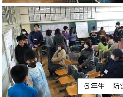
6年生 防災フォーラム