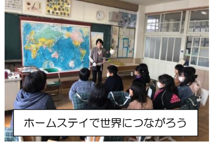
ホームステイで世界につながろう