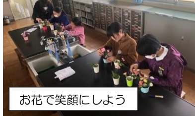
お花で笑顔にしよう