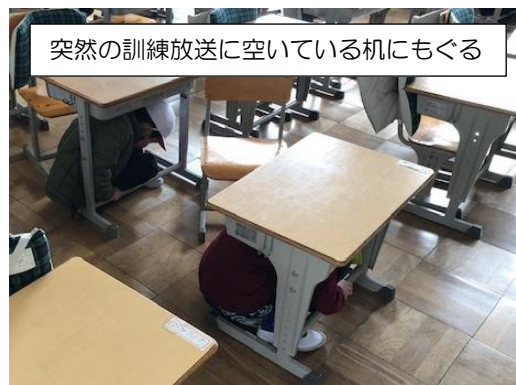
突然の訓練放送に空いている机にもぐる