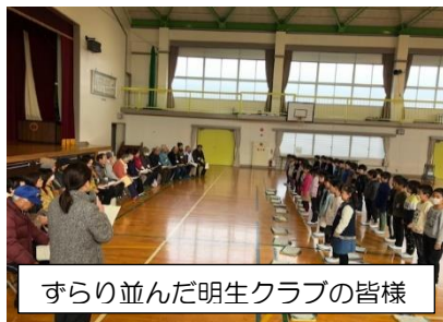
ずらり並んだ明生クラブの皆様

いつまでもこうした人の輪が大切にされる学区であってほしいと思います。明生クラブの皆様、ありがとうございました。