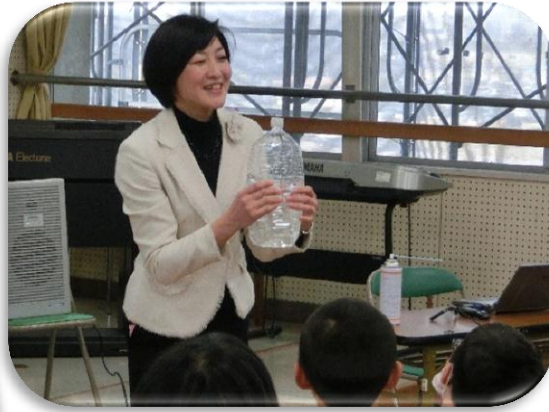
二酸化炭素が水に溶ける実験