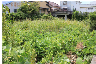
りゅうじんでんせつ

うなぎ池には竜神伝説や大うなぎがいたという伝説があります。昭和48年～平成8年の間は岡崎市の天然記念物に指定されていた、めずらしい池です。今はほとんど水がありませんが、たまにウシガエルの鳴き声が聞こえます。広さは500㎡(平方メートル)と小さいです。