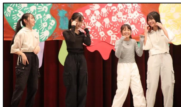
〈3-1の合唱(上)とカラフルステージ(下)〉

合唱コンクール後と午後は、カラフルステージ。太鼓、歌、ハンドベル、ダンス、日本舞踊、お笑い劇など、魅力いっぱいのステージ演技でした。普段は見ることのできない生徒のみなさんの芸は本当に楽しかったです。また、見ている観客の生徒や保護者の方々の応援やマナーの素晴らしさも感じました。来賓の方々もその会場の雰囲気についてはみなさん絶賛されていました。この文化祭を機に額田中がさらにまとまっていけるといいですし、そうなっていけるよう全職員で支えていきたいと思ひます。