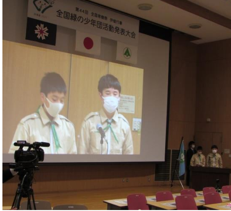
▲みどりの少年団 活動発表

於：ホテルニューオータニイン札幌 北海道大学高等教育推進機構 北海道立総合体育センター