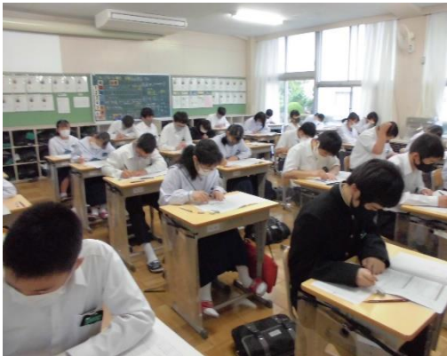
▲じっくり取り組む3年生

全国学力学習状況調査は、全国的な児童・生徒の学習状況を調査・分析し、教育施策や各校の指導の改善につなげ、継続的な検証改善サイクルを生み出すために行われています。令和2年度は学校が全国的に臨時休業であったために実施できず、本年度が二年ぶりとなります。調査内容は教科に関する二つに分かれています。