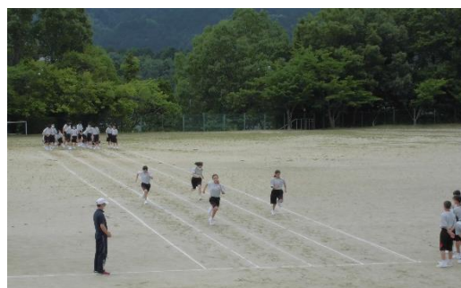
▲ 2年生 50m走

例年よりもずいぶん早い梅雨入りを迎え、雨の日が多くなっていますが、その合間をぬうようにして体育の授業ではスポーツテストを実施しています。昨年はこのスポーツテストも実施できていませんので、生徒の皆さんにとっては二年ぶりとなります。部活動の休止も継続中、保健体育の授業は学校生活で唯一の運動の機会となっています。