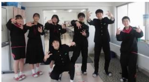
令和3年度前期生徒会役員