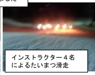
インストラクター4名によるたいまつ滑走

令和3年3月15日(月)、2年生スキー学習の出発式で、次の話をしました。「2年生64名全員参加のスキー学習の始まり。うれしいです。2021年の額中の漢字は「金」です。額中第2期黄金時代を築き、額中開校50年にふさわしい3年生になってほしい。スキー学習を通して2年生が変わるチャンスです」