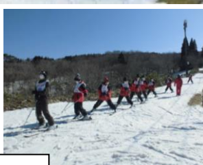
初心者コースは、けがのないように準備運動を大切に1歩ずつ着実に技術を向上させました