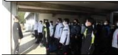
出発式 8:05 長谷川教頭先生に挨拶