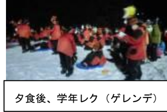
夕食後、学年レク(ゲレンデ)