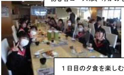
1日目の夕食を楽しむ