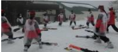
2日目の午後は雨。ゴミ袋でカップを作り滑る