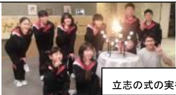
立志の式の実行委員