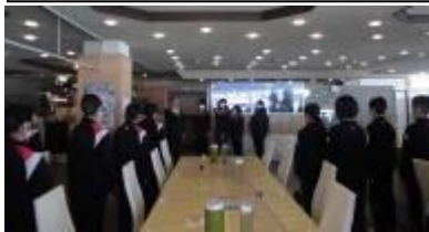
入所式 11:25 井上支配人様の挨拶