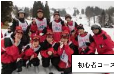
初心者コースの4班・6班

スキー学習のテーマ「だれもがリーダー～新たな額中への第一歩 助け合い支え合う集団へ～」3月16日(火) 感動的な立志の式でした。あの涙、決意を忘れずに。保護者の皆様のご協力に感謝しています。 今の2年生なら額中第2期黄金時代を築き、額中開校50年にふさわしい3年生になれると確信