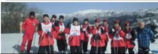
3日目は晴天。リフト頂上の最高の景色を楽しむ

2年生は幸せです。多くの人の支えに感謝しましょう。3月17日(水) ホテル、インストラクターの皆様が、褒めてくださいました。