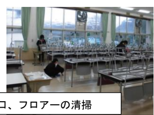
食堂出入口、フロアの清掃