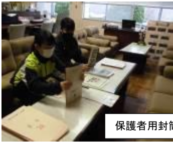
保護者用封筒と袋の準備