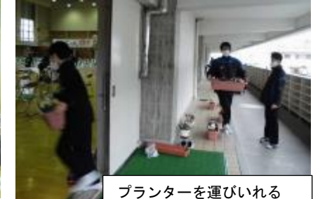
プリンターを運び入れる