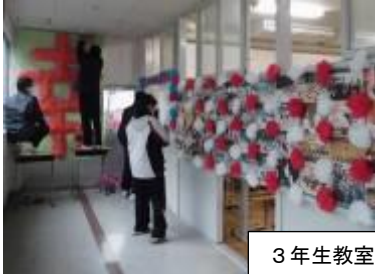
3年生教室の廊下に心温まる掲示