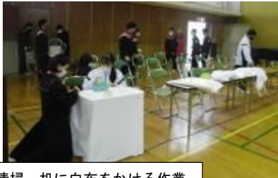
体育館の赤じゅうたんの清掃、机に白布をかける作業