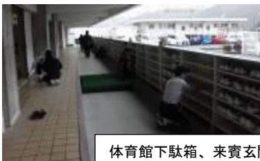
体育館下駄箱、来賓玄関前の清掃