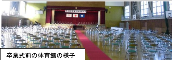
卒業式前の体育館の様子