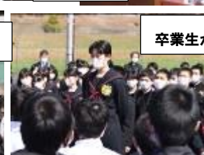
卒業生から万歳三唱