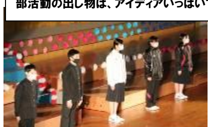
3年生からのメッセージ