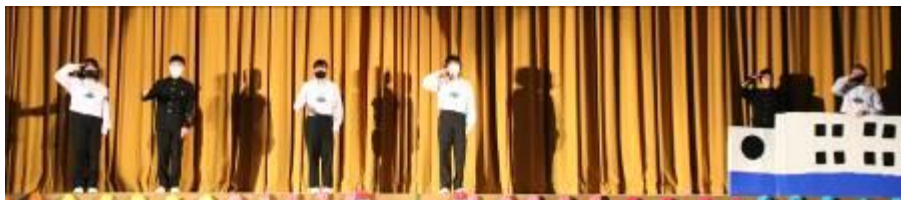
オープニングでは、3年生を夢の世界へ連れていってくれる工夫がありました。