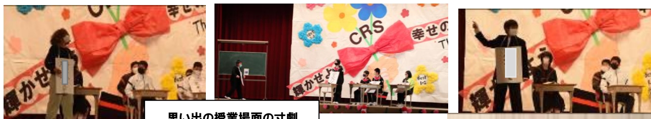
思い出の授業場面の寸劇