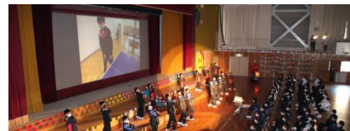
卓球部男子がトップバッターで会を盛り上げる