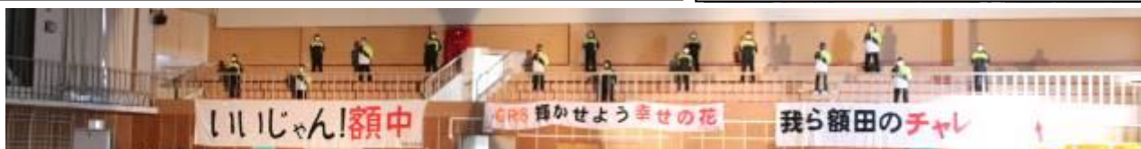
テニス部女子が、観覧席からあこがれの先輩に心のこもったメッセージを届けました。堂々とした姿に感動しました。

令和3年2月24日(水)、13:20に3年生入場で始まった「3年生を送る会」は、大成功で感動的なものでした。3年生が、いつも学校の顔として自分から進んで動き、 あこがれの先輩 であったので、1・2年生、そして、先生たちも、 感謝と激励の気持ち を3年生に届けようと努力しました。オープニングでは、3年生を夢の世界へ連れ出す工夫がありました。ビデオレターでは、1年生の時の担任のO先生、2年生の時にお世話になったK先生、S先生から激励のメッセージが放映されました。