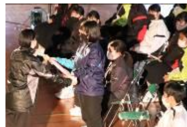
1・2年生から3年生へのメッセージ。1・2年生が3年生からバトンを受け継ぐ

3年生が、1・2年生に「これからの額田中を託す」とメッセージを伝えました。1・2年生が、これに応じて、「額中第2期黄金時代を築きます」と力強い言葉を述べました。そして、生徒会長から1・2年生にバトンの受け渡しが行われました。「頼むぞ、1・2年生」という気持ちがこめられていました。令和2年度から令和3年度への引き継ぎも兼ねた「3年生を送る会」でした。