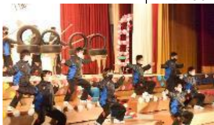
部活動の出し物は、アイデアいっぱい最高でした