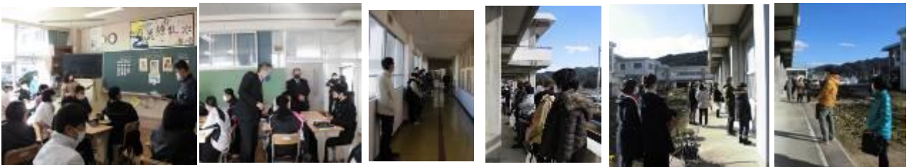
保護者の皆様には、新型コロナ対策のため、たいへん寒い中、廊下、ベランダからの授業参観にご協力していただきありがとうございました。