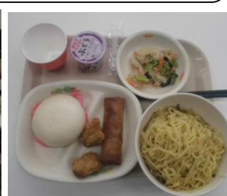
寮生のために夕食の準備してくださる調理員さんに感謝。11月19日(木)の夕食は中華