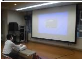
寮生活の紹介DVDの設定をするS先生

2年生が優しく丁寧に6年生に寮生活について説明していました。2年生の人間的な成長がうれしかったです。