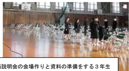
11月4日(水) 7:50~8:10 進路説明会の会場作りと資料の準備をする3年生