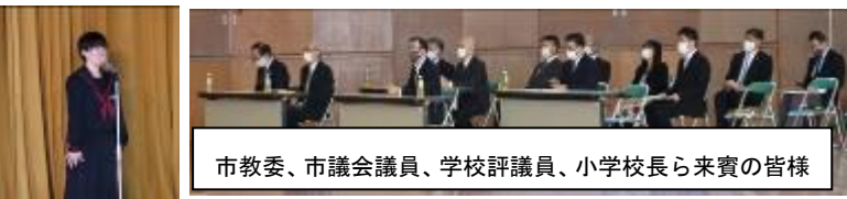
市教委、市議会議員、学校評議員、小学校長ら来賓の皆様