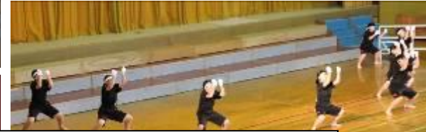
11組の特出の発表で会場が盛り上がりました