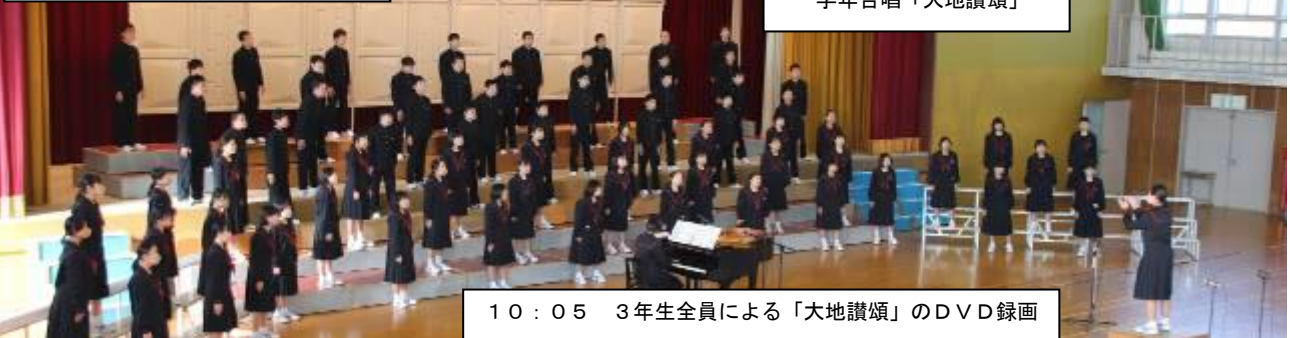
10:05 3年生全員による「大地讃頌」のDVD録画