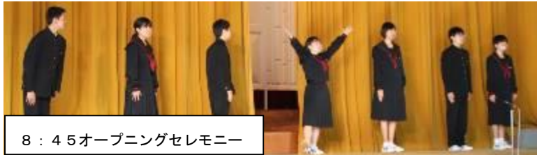
8:45 オープニングセレモニー

「額中第2期黄金時代」にふさわしい合唱になりました。保護者の皆様には、新型コロナ対策としてマスク着用、ソーシャルディスタンス、入場制限による参観者の入れ替え等にご理解、ご協力をいただきありがとうございます。