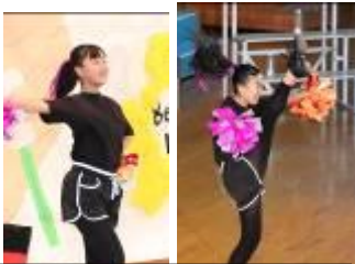
12:03 ステージ発表終了