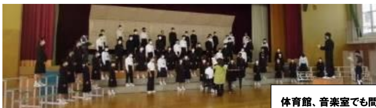
体育館、音楽室でも間隔をとって合唱練習