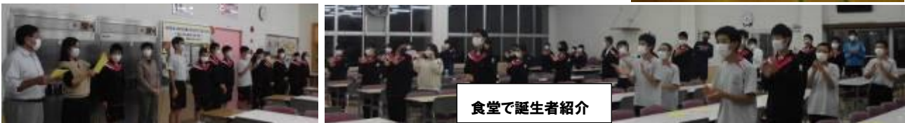
食堂で誕生日者紹介