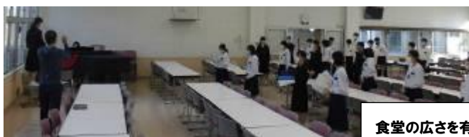
食堂の広さを有効活用