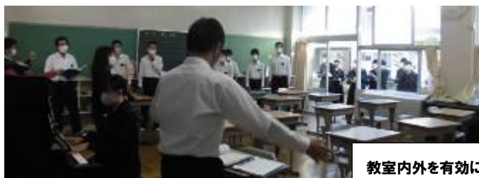
教室内外を有効に使って三密対策の合唱練習