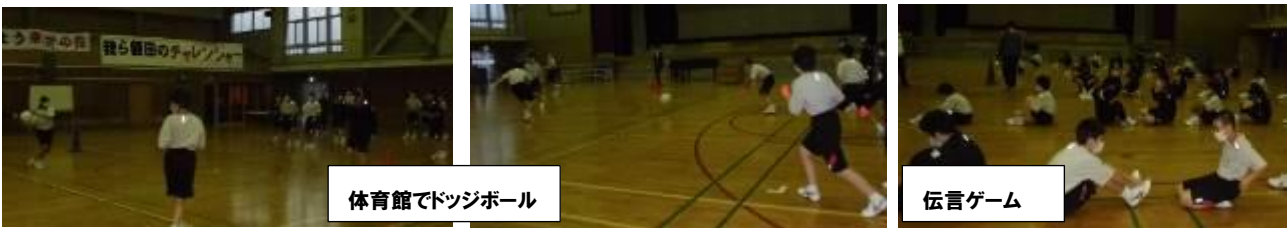
体育館でドッジボール