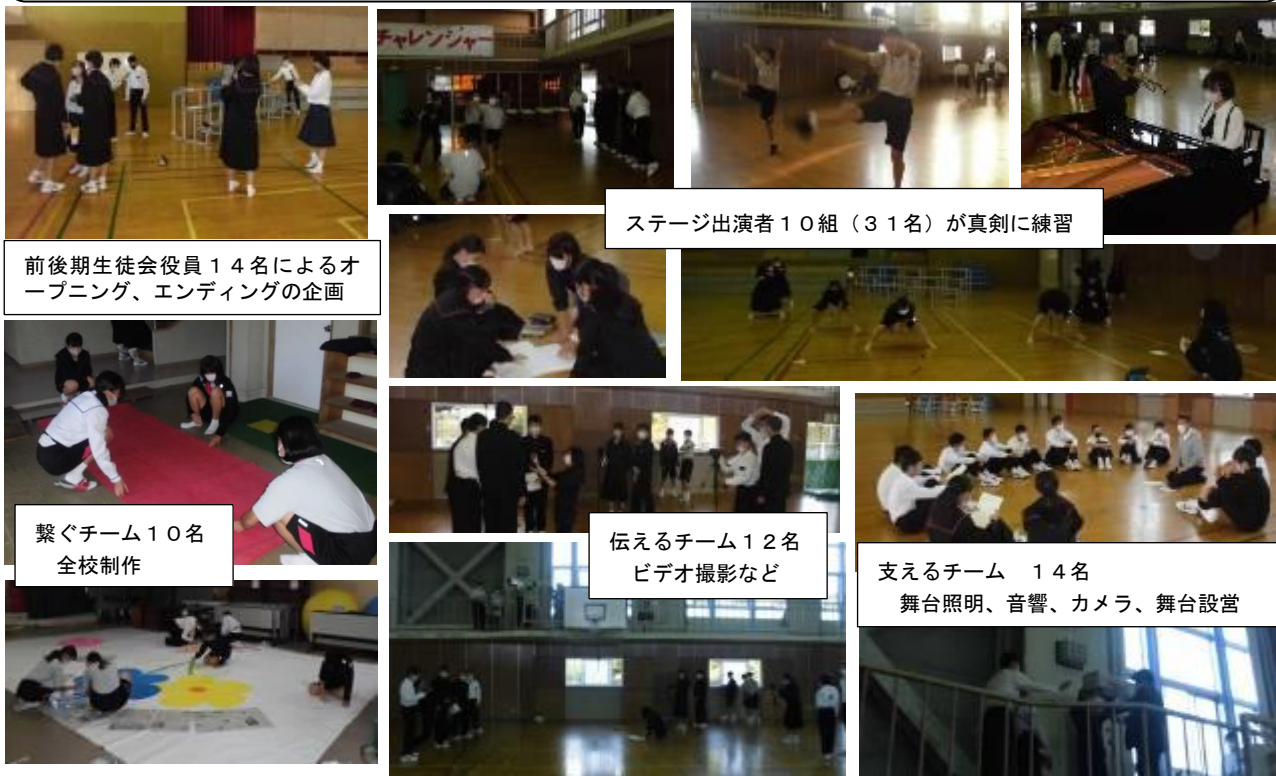
ステージ出演者10組(31名)が真剣に練習

10月21日(水)から部活動停止とし、40分間(16:00~16:40)に、文化祭の準備、練習を行います。