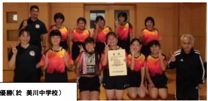
10月18日(日)新人戦 卓球の部 女子 準優勝(於 美川中学校)

10月11日(日)、卓球部女子は、13:40の試合開始に合わせて、10:00~11:30、最後の詰めとなる練習をしました。特に、サーブ練習、レシーブ練習、ツッツキで粘り切る練習、チャンススマッシュで決める練習をしました。卓球部男子とバレーボールの惜敗のメールが入り、生徒には卓球部女子が額田中学校として新人戦の締めくくりとなる大会になるので、自分の力をすべて出し切ろうと激励しました。2年生5名、1年生5名の計10名全員が、登録メンバーとして大会に臨みました。得意のサーブと粘りで、決勝戦まで進みました。今回の新人戦は、5名のシングルス戦だったので、2年生5名が、4試合すべてに選手として出場して「 努素心言 」魂で頑張りました。1年生5名も、審判と応援で勝利に貢献しました。新チームになって初めての大会で、かなり緊張していましたが、 Challenge 精神で、お互いを Respect し、最後は Smile になれるように全力を尽くしました。 今後の課題は、攻撃力をアップすることで、特にループドライブの安定性を高めることであることに気づきました。