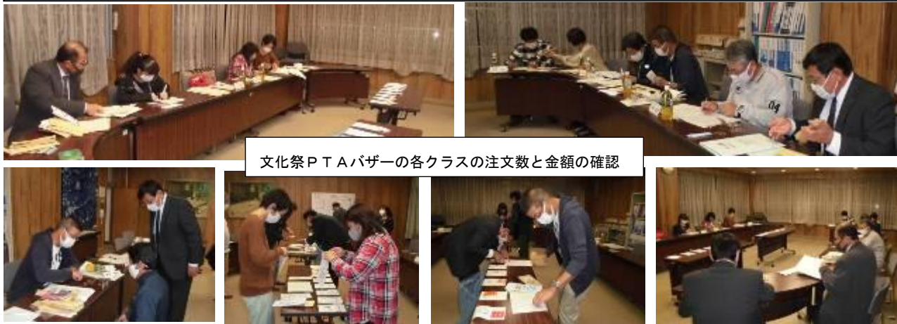
文化祭PTAバザーの各クラスの注文数と金額の確認

10月31日(土)の文化祭が晴天に恵まれ、生徒と保護者、地域の皆様に幸せの花が咲くことを願っています。今後ともPTA活動へのご理解とご協力をお願いします。