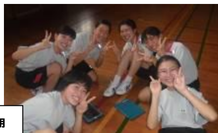
3年生の体育の授業に、動画を見て動きを覚えるためにMyタブレットの活用

8月31日(月)に生徒一人一人に貸与されたMyタブレットが配付されました。2年生は、例年ならば8月末に職場体験学習を実施してきました。本年度は、新型コロナウイルス感染拡大防止のため、外部の方との接触をなくす方向で進めた結果、職場体験学習を中止しました。これは、他校も同じです。自分の興味のある職業調べをする上で、配付されたMyタブレットは大変有効でした。生徒は、自分から進んで職業を調べていました。