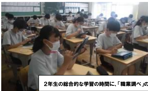
2年生の総合的な学習の時間に、「職業調べ」のためにMyタブレットの活用