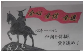
2年1組「全心 全信 全進」