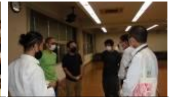
2階ホール(1の1)、図書室(1の2)で、新入寮生保護者と寮監、1年生教員による座談会