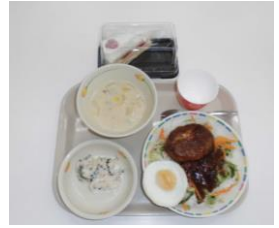
18:00~18:25 三密対策をして、食堂で夕食をとるPTA寮運営委員の皆さん