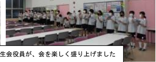
18:25~18:35 4・5・6・7月の誕生者会 寮生会役員が、会を楽しく盛り上げました