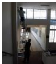
2階渡りの壁、天井の補修工事