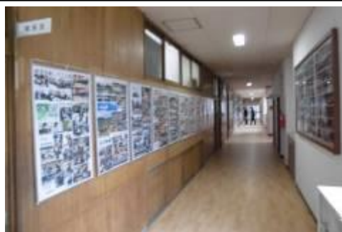
きれいになった玄関から職員室前の廊下

令和2年11月11日(水)の研究発表会、令和3年度額田中学校開校50年式典に向けて、令和元年度当初から岡崎市に校内環境整備の要望をしてきました。岡崎市施設課の方が来校されて、改修可能な箇所の確認をしていただきました。3月下旬、最初に玄関から職員室前廊下の改修工事を実施してくださいました。4月6日(月)の入学式準備、4月7日(火)の入学式に来た生徒が、「明るくきれい」と笑顔でうれしそうに話していました。理科室の天板、普通教室棟の流し、体育館のトイレなどの改修工事もしてくださいました。残念ながら、4月8日(水)から5月6日(水)までが、臨時休校になったので、生徒の皆さんは、きれいになった校内に気づくことができませんでした。5月7日(木)に登校したら校内環境を見てください。やる気の出る環境になったので、環境に負けないように、自分を高める努力をしましょう。