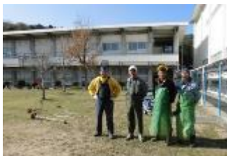
校務員さんと寮監さんが特別棟前周辺の草刈りをしてくださいました