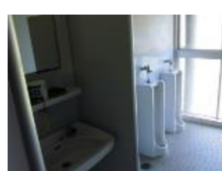
体育館2階のトイレもきれに