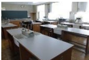
理科室の天板と体育館入口の緑のマットが新しくなりました