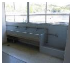
教室棟1階、2階、食堂の流しの補修工事をしてもらいました。今後、いつもきれいな流しになるように、清掃活動をしっかりと行いましょう