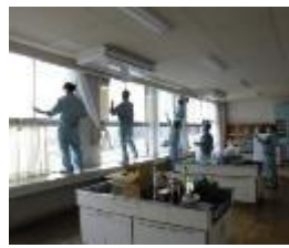
飛散フィルムを張る作業