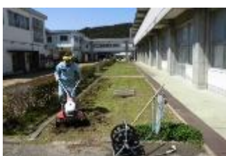
3年教室前の花壇を耕運機で耕し、玄関周辺の草取りをしました