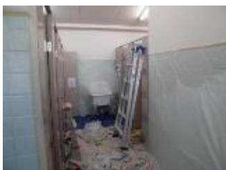
体育館1階のトイレの壁、ドアなどが、新しくなりました。いつもきれいで清潔なトイレにしていましよう