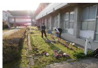
職員会議後、3年教室前の花壇の環境整備をする教職員