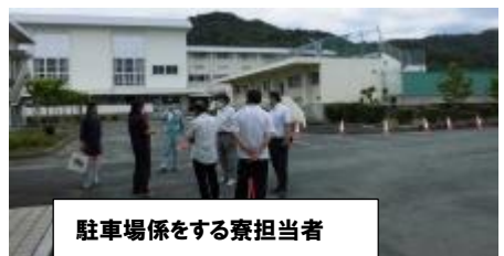
駐車場係をする寮担当者