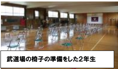
武道場の椅子の準備をした2年生