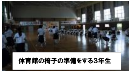
体育館の椅子の準備をする3年生