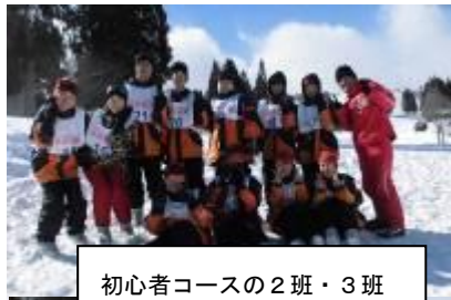
初心者コースの2班・3班