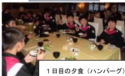
1日目の夕食(ハンバーグ)