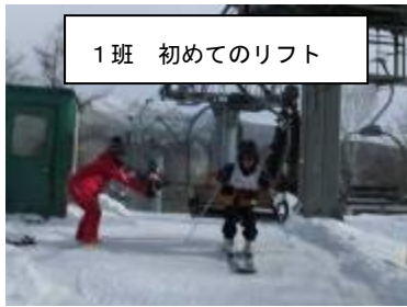
1班 初めてのリフト

スキー学習のテーマ「みんなちがって みんないい～こえよう〇〇の壁 つくろう輝ける場～」 2月6日(木) 感動的な立志の式でした。あの涙、決意を忘れずに。保護者の皆様のご協力に感謝しています。 今の2年生なら「C(Challenge)R(Respect)S(Smile)」で額中第2期黄金時代を築いてくれると確信