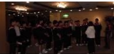
立志の式の準備をする生徒、教員