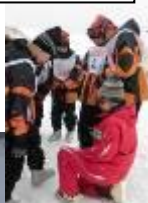
倒れた時に起き上がる練習