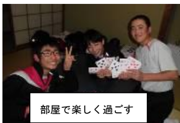
部屋で楽しく過ごす