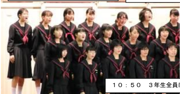
10:50 3年生全員による「大地讃頌」のDVD録画