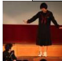
イングリッシュフェスティバルに出場した生徒の発表