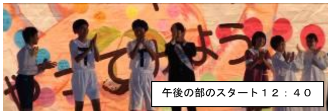
午後の部のスタート12:40