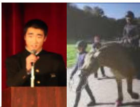
ウッデバラ中学生訪問団参加報告