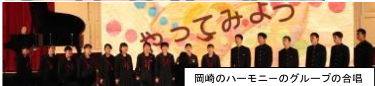
岡崎のハーモニーのグループの合唱