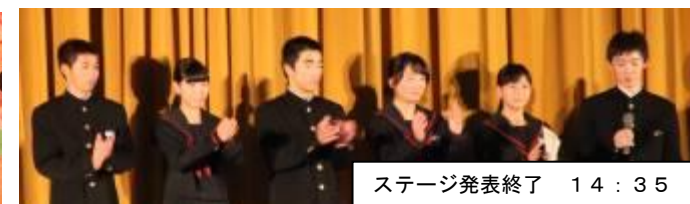
ステージ発表終了 14:35