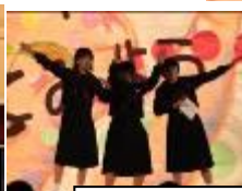
全校レクリエーション