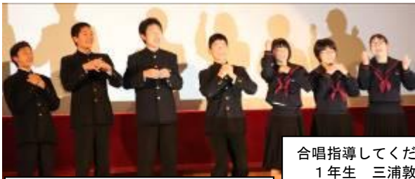
オープニングセレモニー 8:50