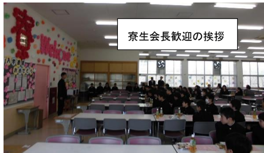
寮生会長歓迎の挨拶