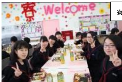
寮生会役員6名のパフォーマンス