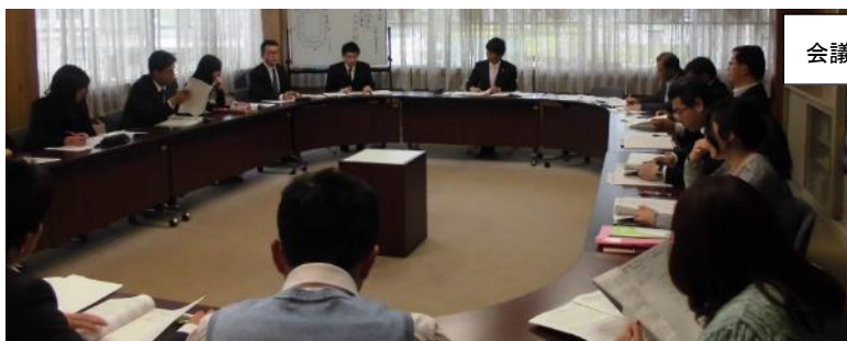
会議室で研究全体協議会