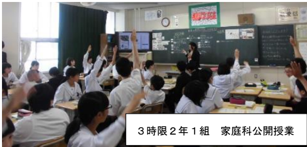
3時限 2年1組 家庭科公開授業