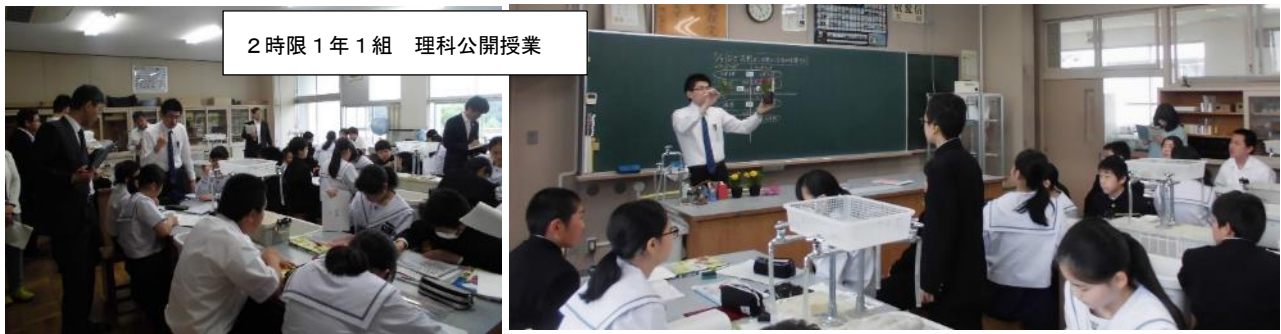
2時限 1年1組 理科公開授業