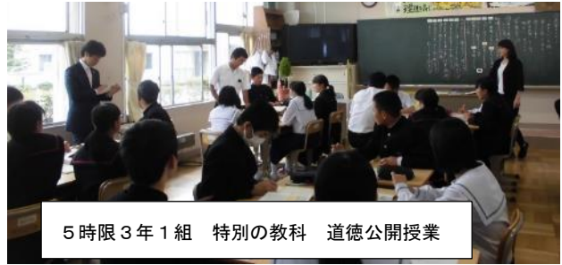
5時限 3年1組 特別の教科 道徳公開授業