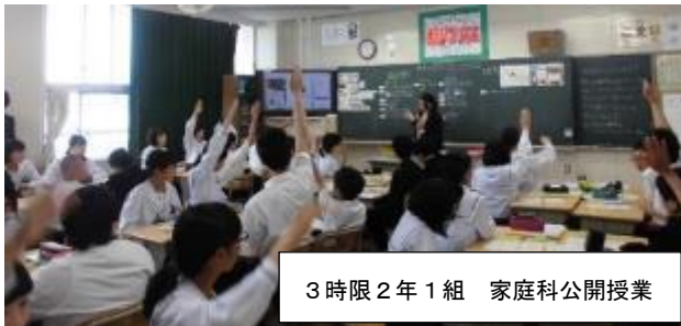
3時限 2年1組 家庭科公開授業