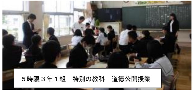
5時限 3年1組 特別の教科 道徳公開授業