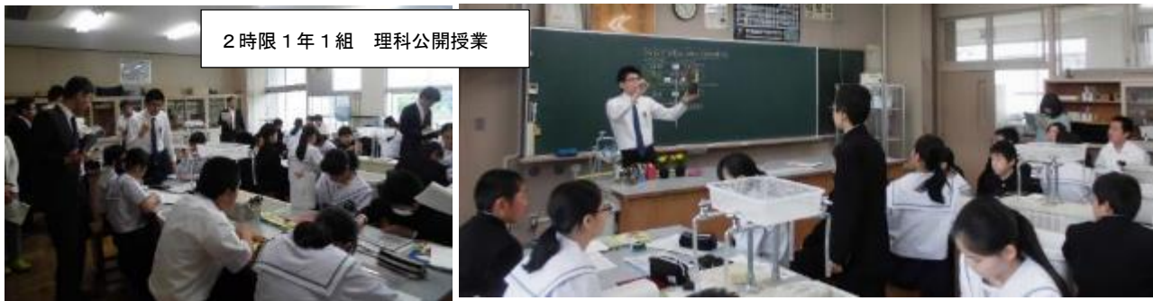
2時限 1年1組 理科公開授業