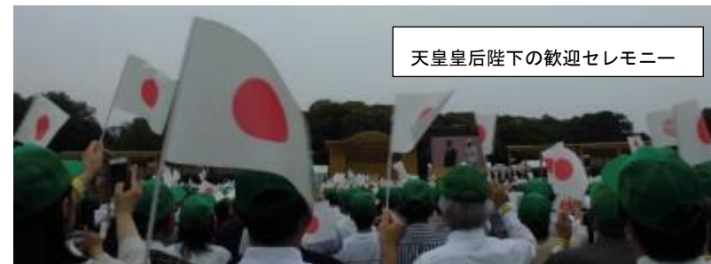
天皇后陛下の歓迎セレモニー