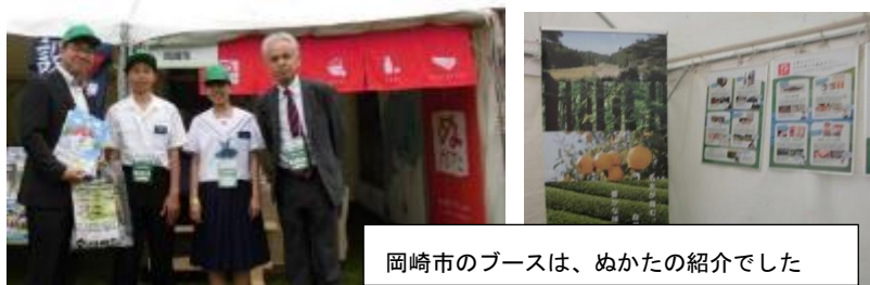
岡崎市のブースは、ぬかたの紹介でした